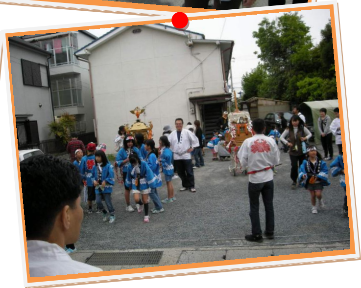
友岡区春祭り(小倉神社)