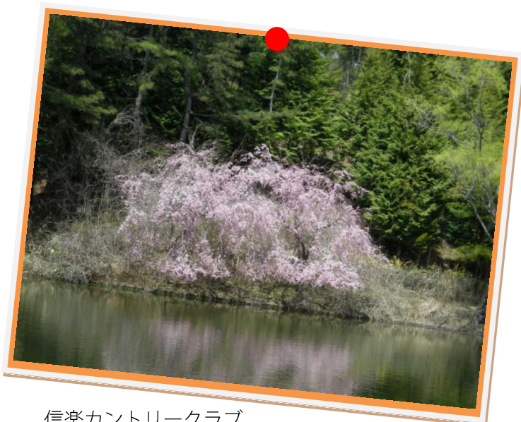
信楽カントリークラブ キレイな桜に思わずシャッター。