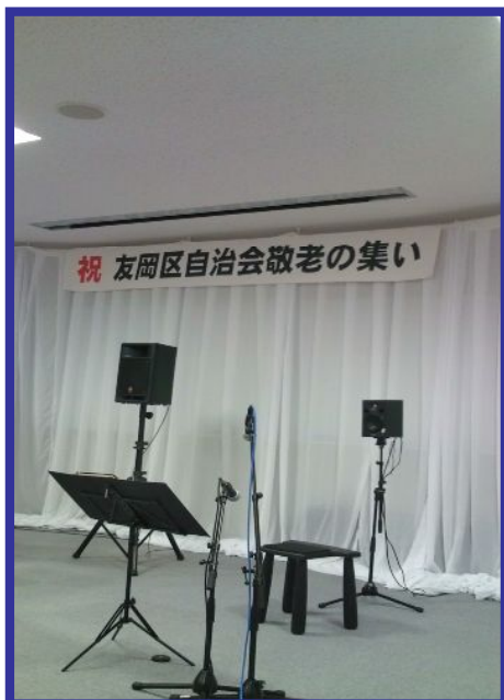
9月15日 友岡区自治会敬老の集い オカリナの奏