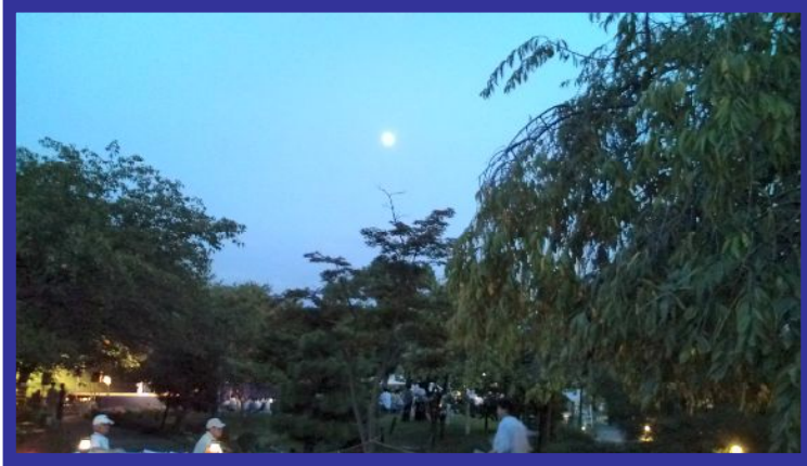
9月10日 名月の宴 天気にもめぐまれとても幻想的でした

発行:かみむら しんぞう後援会 〒617-0843 長岡京市友岡西山17 TEL 075-951-7496 E-mail:shinzou9n@yahoo.co.jp